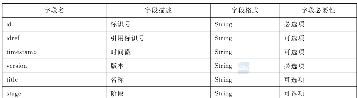
表 15 应对措施字段描述