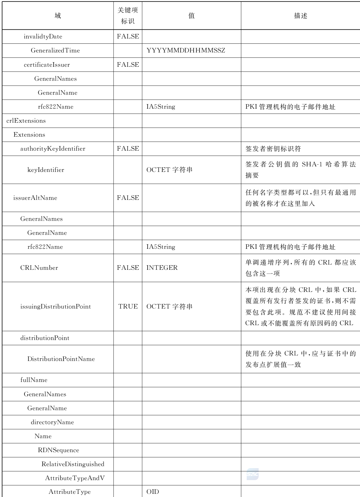
表 C.5 (续)